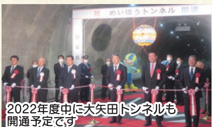
2022年度中に大矢田トンネルも開通予定です